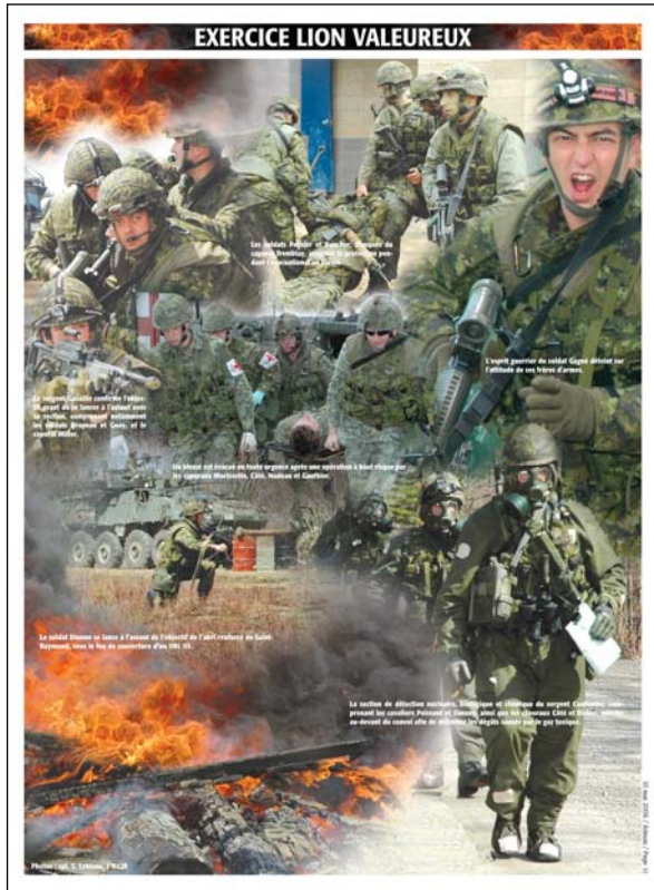
Page photos couleur Journal Adsum