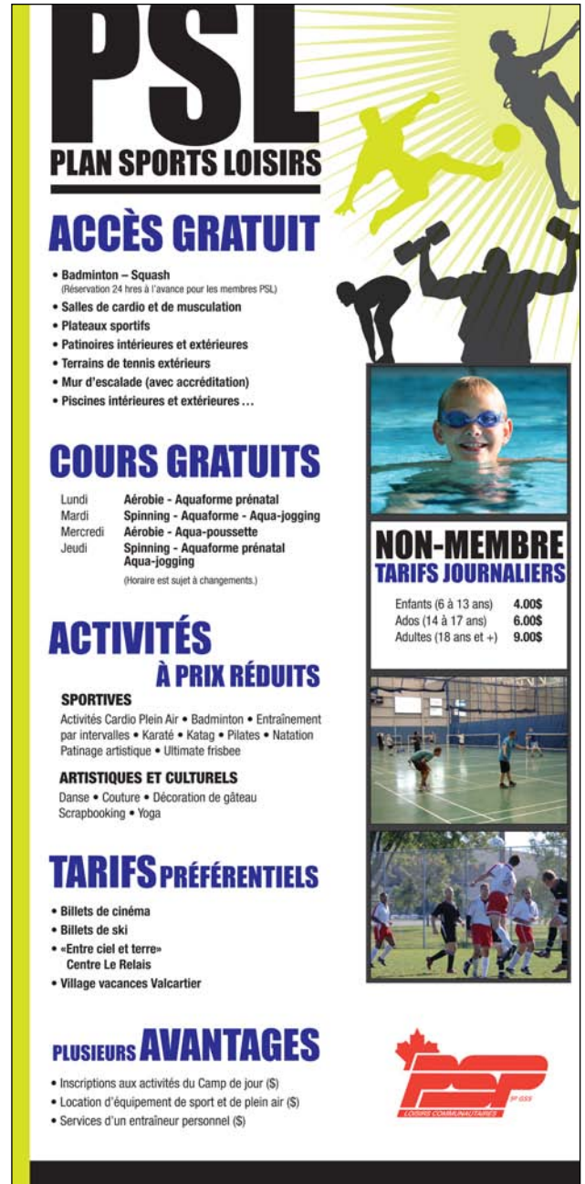
Bannière couleur 3' x 6' Loisirs communautaires - Garnison Valcartier