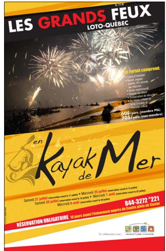
Affiche couleur Centre Castor - Garnison Valcartier