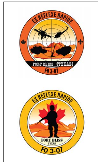
Logos couleur Force opérationnelle 3-07