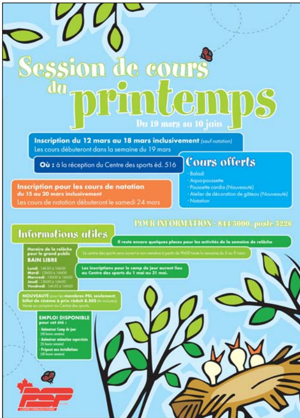
Publicité couleur Loisirs communautaires - Garnison Valcartier