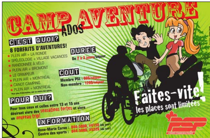
Publipostage couleur Loisirs communautaires - Garnison Valcartier