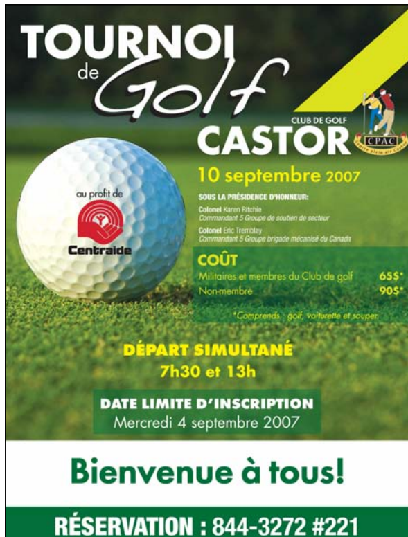
Affiche couleur Centre Castor - Garnison Valcartier